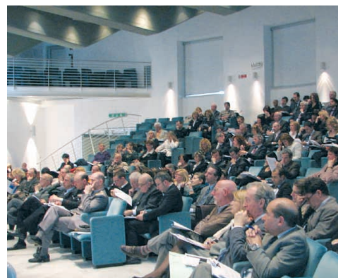
CONVEGNO Il folto pubblico presente all'incontro di Equitalia.